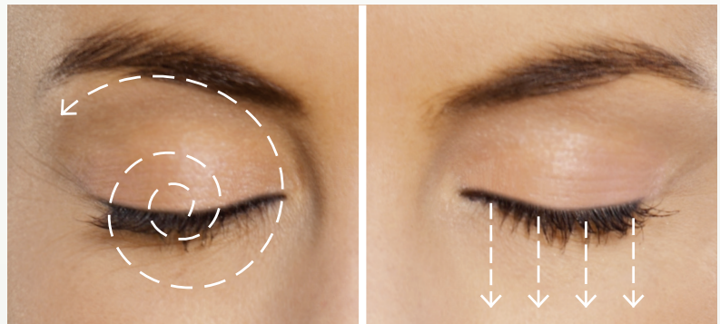
Fig. 1 : Appliquer la lingette I-LID 'N LASH® PLUS dans un mouvement circulaire commençant à la racine des cils et progressant vers les paupières et les sourcils.

Pour l'ÉTAPE 6 faire le mouvement comme décrit ci-dessous