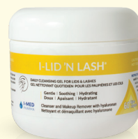
60 Pre-soaked Wipes